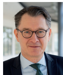
Jochen Schmidt Direktor der Landeszentrale für politische Bildung

erneut in Mecklenburg-Vorpommern angeboten wird. In über 150 Schulen Mecklenburg-Vorpommerns fand die Juniorwahl zur Bundestagswahl 2025 statt. Alle, die beteiligt waren, empfanden diese Veranstaltung als großen Erfolg und Bereicherung.