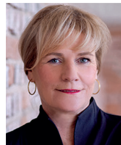
Simone Oldenburg Ministerin für Bildung und Kindertagesförderung

das Bildungsministerium und die Landeszentrale für politische Bildung unterstützen sehr gern das Projekt „Juniorwahl 2026“, mit dem das Thema „Wahlen und