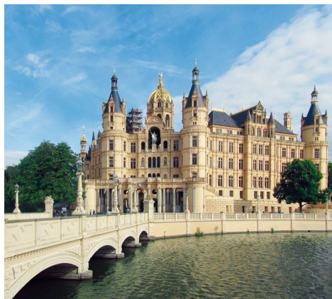
Landtag Mecklenburg-Vorpommern: https://karriere-in-mv.de/beh%C3%B6rde/61/landtag-mecklenburg-vorpommern